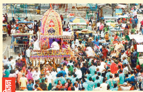
नेहों का आयोजन